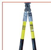
Cortador Cables 25 kV