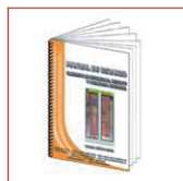
Manual de Usuario