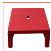
Banqueta Aislada 45 kV