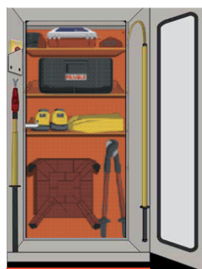
Disposición de los EPP