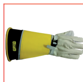
Guante Clase 2 (17 kV)