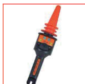
Detector 80 V - 132 kV