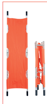
Camilla de rescate