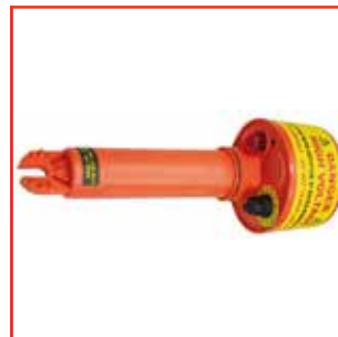
Detector 220 V - 275 kV