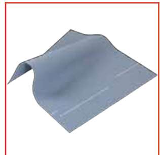
Alfombra Aislada 36 kV