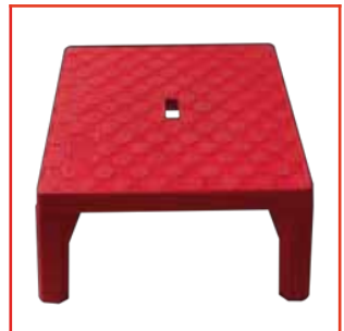
Banqueta Aislada 45 kV