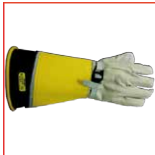
Guante Aislante 17 kV